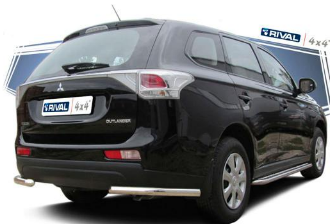
Mitsubishi Outlander 2012