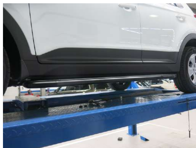
Общий вид автомобиля с порогами