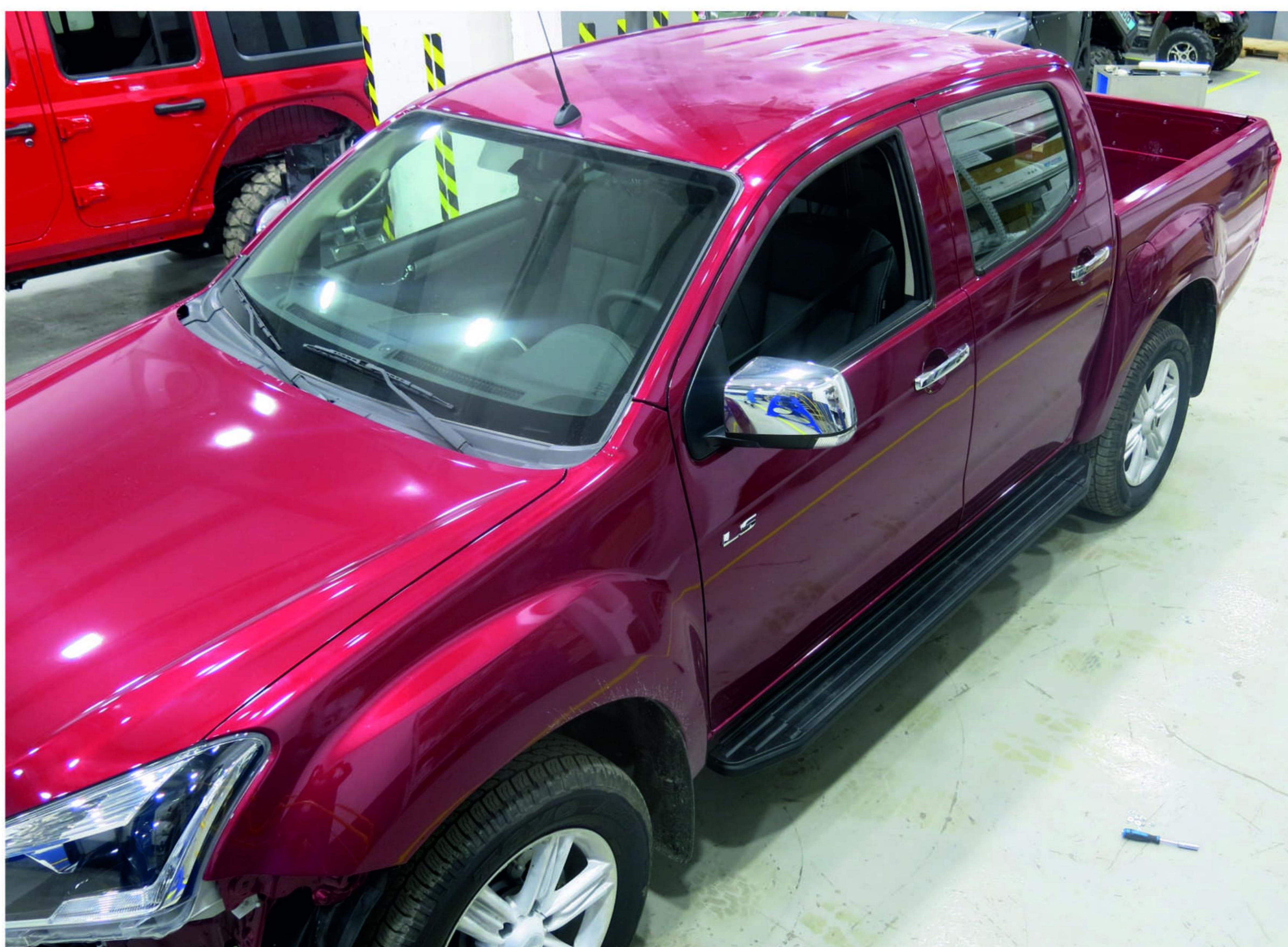
Общий вид автомобиля с порог-площадкой

Перед установкой изделия необходимо убедиться, что автомобиль, на который планируется установка, соответствует модельному ряду, указанному в настоящей инструкции. В случае затруднений с определением соответствия обращайтесь службу технической поддержки supp@rivalauto.com . В случае наезда на препятствие необходимо убедиться в отсутствии повреждений и агрегатов автомобиля и пригодности дальнейшей эксплуатации порогов. При правильной установке пороги не должны касаться узлов и агрегатов автомобиля. Производитель вправе вносить изменения в конструкцию порогов.