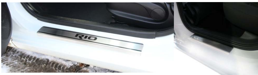
Фото установленных накладок