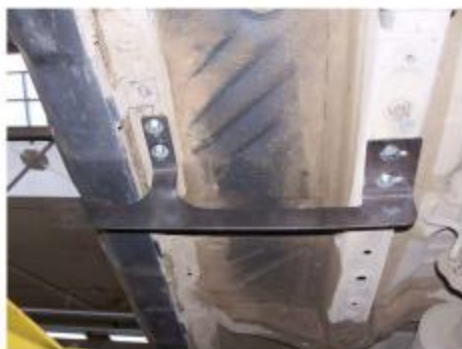
Рис.4 Установка переднего кронштейна