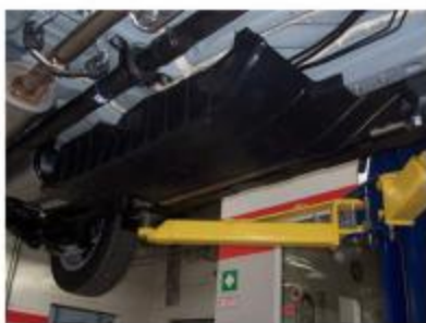
Рис.2 Пыльник автомобиля