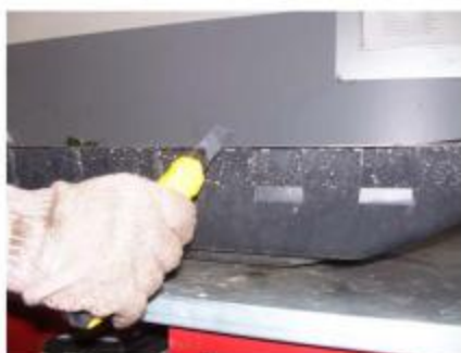
Рис.6 Пазы в пластиковом пыльнике