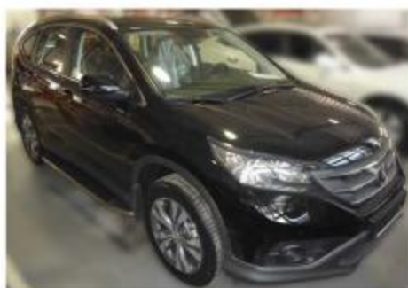
Рис.7 Вид автомобиля с порогом