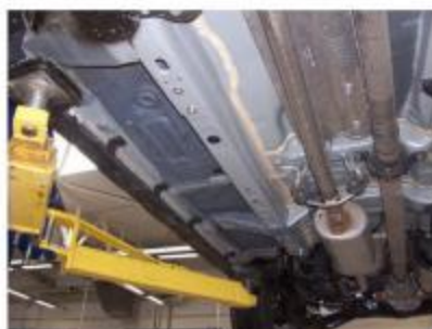
Рис.3 Снятие пыльников