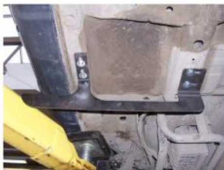
Рис.5 Установка заднего кронштейна