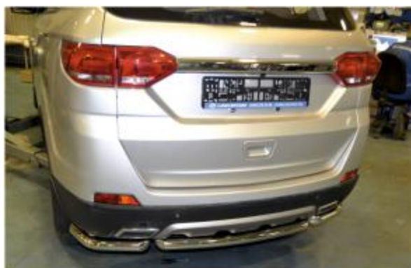
Рис. 4 - Общий вид автомобиля с защитой