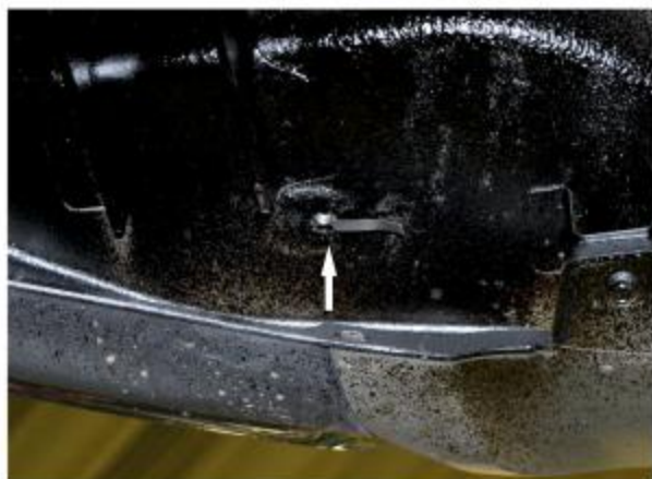
Рис. 1 - Установка закладной гайки