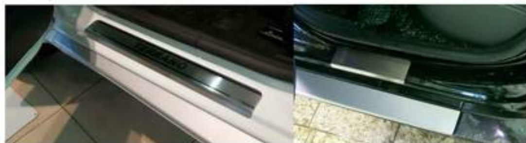
Фото установленных накладок

Накладки на остальные пороги устанавливаются аналогичным образом.