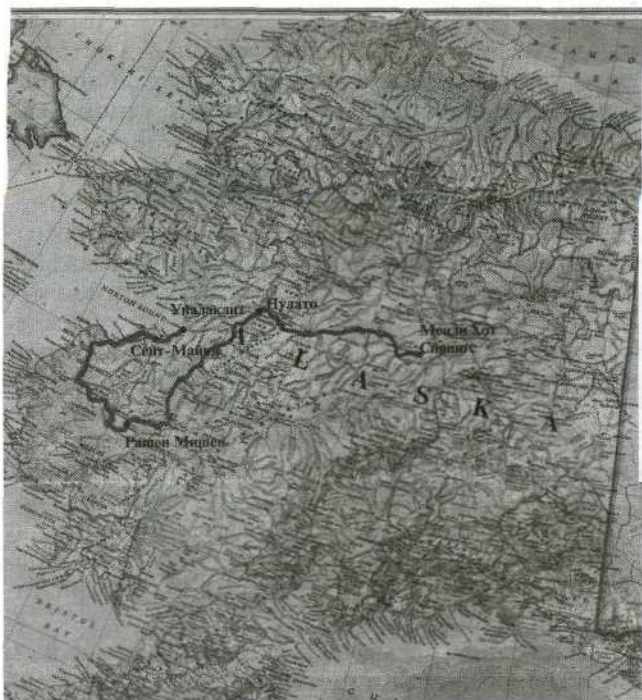
Маршрут экспедиции 2009 г. Реки Кускоквим и Юкон

на эту тему находятся во многих городах от Сахалина до Санкт-Петербурга.