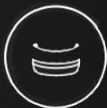
Изогнутая нагревательная пластина