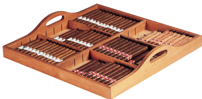
Выдвижная полка + переносной поддон