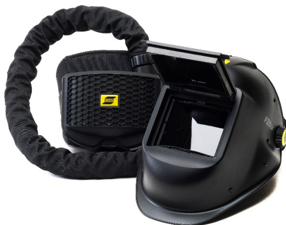
F20 Air с ESAB PAPR