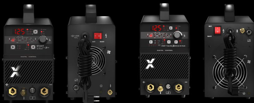
АППАРАТ АРГОДУГОВОЙ СВАРКИ START Tigline X200 DC PULSE