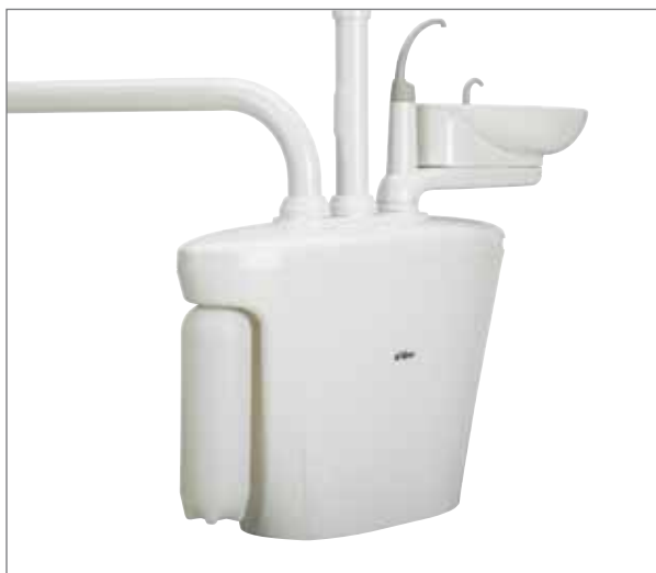
Бутылка автономной системы водоснабжения.

Фарфоровая плевательница поворачивается в удобное для пациента положение. Легко наполняемая бутылка объемом два литра обеспечивает постоянную подачу воды для проведения различных процедур. На центральном опорном блоке может быть размещено дополнительное оборудование, например отделители амальгамы и вакуумные системы.