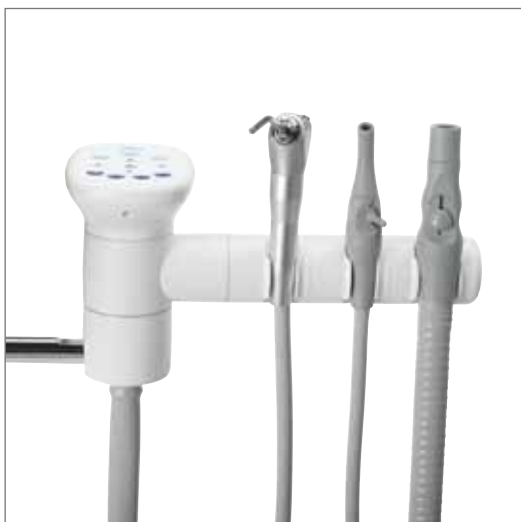
Отдельный трехпозиционный держатель показан с дополнительной сенсорной панелью и пистолетом.

Трехпозиционный держатель и телескопический кронштейн обеспечивают надлежащее положение вакуумных инструментов для удобного доступа к пациенту.