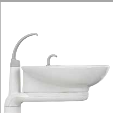
Возможность установки вращающейся плевательницы из сантехнического фарфора