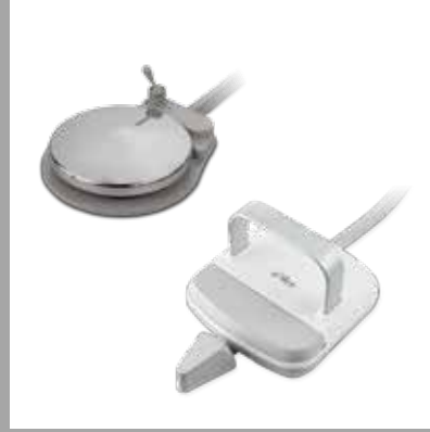
Дисковая или рычажная педаль управления