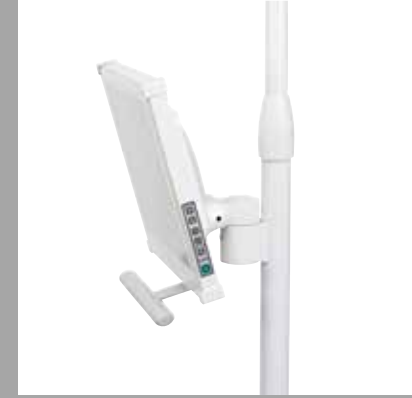
Возможность установки монитора