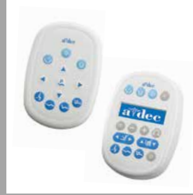
Стандартная или улучшенная сенсорная панель