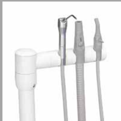
Трехпозиционный держатель инструментов для ассистента с отсосом высокой производительности Durr, слюноотсосом и дополнительным пистолетом вода-воздух