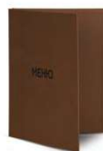
Папка для меню пмп106 250x320 мм