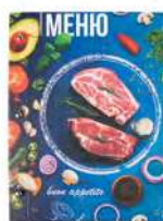
Папка для меню «Фреш» кашированный картон пмпк106 245x320 мм