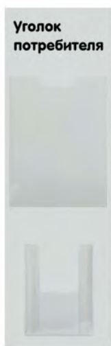
Стенд «Уголок потребителя» 2 кармана 9570 240x750 мм / белый