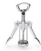
Штопор рычажный 2583 165 мм