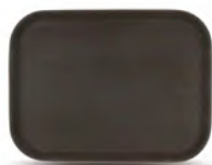
Поднос прямоугольный прорезиненный / коричневый кт05 400x300x25 мм