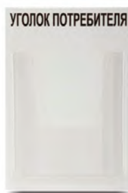
Стенд «Уголок потребителя» 1 карман 9569 260x400 мм