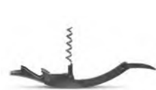
Нарзанник трехфункциональный кт2202 113 мм