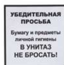
Информационная наклейка «Не бросать» 9595 200x200 мм