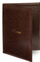
Папка для меню пмпи108 250x320 мм