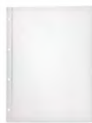
Файл для меню пмпи01 А4