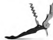
Нарзанник двухступенчатый 8213/1 120 мм