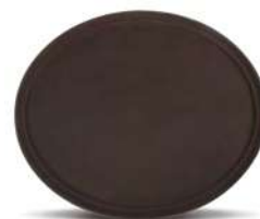
Поднос овальный прорезиненный / борт 45 мм кт04 680 мм / коричневый