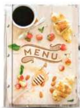
Папка для меню «Круассан» кашированный картон пмпк023 245x320 мм