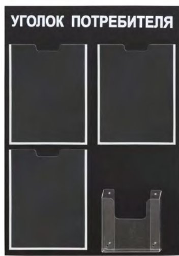
Стенд «Уголок потребителя» 4 кармана 9573 500x750 мм / черный