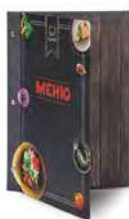
Папка для меню «Салат» кашированный картон пмпк103 245x320 мм