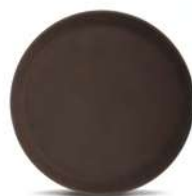
Поднос круглый прорезиненный / борт 25 мм кт01 270 мм / коричневый кт02 350 мм / коричневый кт03 400 мм / коричневый