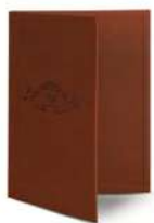
Папка для меню пмпи109 250x320 мм