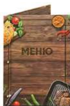
Папка для меню «Бургер» кашированный картон пмпк19 245x320 мм