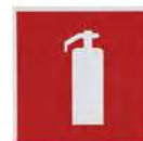
Информационная наклейка «Огнетушитель» 9589 200x200 мм