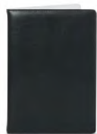
Папка для меню кт0715 230x315 мм