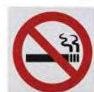
Информационная наклейка «Не курить» 9588 200x200 мм