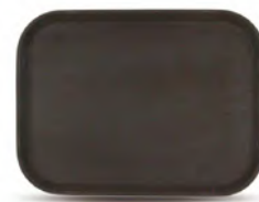
Поднос прямоугольный прорезиненный / коричневый кт324 500x380x25 мм