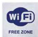
Информационная наклейка «Wi-Fi» 9594 200x200 мм