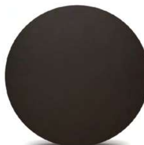
Меловая доска круглая / без рамы