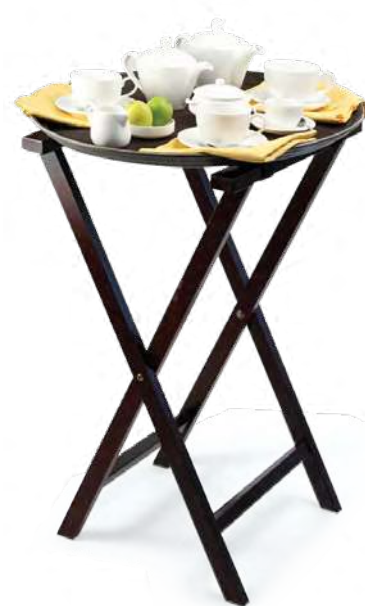
Подставка для подноса (триджек) дерево 1149 830x440 мм