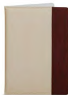
Папка для меню кт0713 230x315 мм