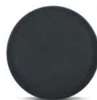
Поднос круглый прорезиненный / борт 25 мм кт940 350 мм / черный кт939 400 мм / черный