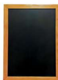
Меловая доска с рамой / сосна