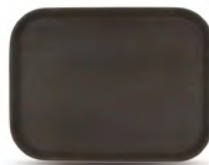
Поднос прямоугольный прорезиненный / коричневый кт06 455x355x30 мм