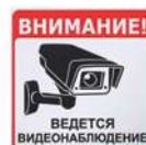
Информационная наклейка «Ведется видеонаблюдение» 9591 200x200 мм