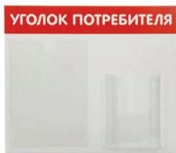
Стенд «Уголок потребителя» 2 кармана 9571 500x420 мм