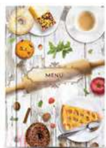
Папка для меню «Скалка» кашированный картон пмпк021 245x320 мм