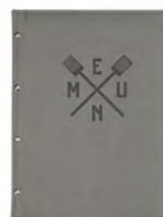
Папка для меню пмп112 250x320 мм