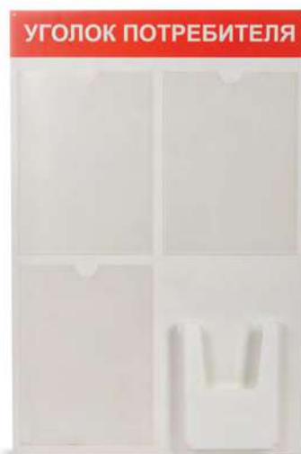
Стенд «Уголок потребителя» 4 кармана 9572 500x750 мм / красный