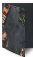
Папка для меню «Суши» кашированный картон пмпк026 245x320 мм