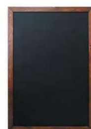
Меловая доска с рамой / мореное дерево