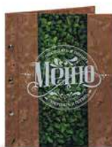
Папка для меню «Гринфуд» кашированный картон пмпк108 245x320 мм