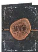
Папка для меню «Дарквуд» кашированный картон пмпк109 245x320 мм