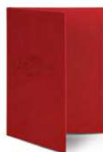
Папка для меню пмп111 250x320 мм