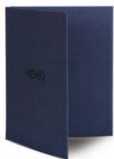
Папка для меню пмп104 250x320 мм