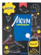
Папка для меню «Салют» кашированный картон пмпк105 245x320 мм