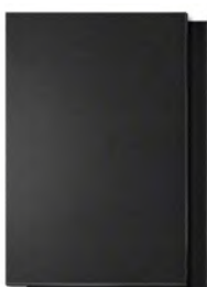
Меловая доска без рамы