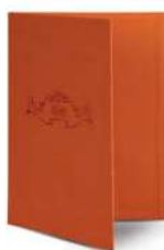
Папка для меню пмп110 250x320 мм