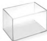
Коробка для чеков 9197 180x120x120 мм