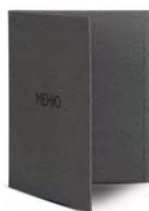
Папка для меню пмп105 250x320 мм