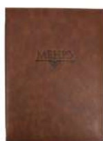
Папка для меню пмпи113 250x320 мм