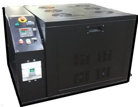
Рис.1. Общий вид парогенератора

Парогенератор по заказу комплектуется выходным паровым быстроразъемным соединением (БРС) с помощью которого через гибкий паровой рукав установка подсоединяется к паропотребляющему оборудованию.