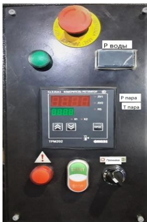
Рис.3. Пульт управления

1 – фильтр, 2 – клапан соленоидный, 3 – питательный насос, 4 – датчик давления воды, 5 – индуктор, 6 – обратный клапан, 7 – датчик давления пара, 8 – датчик температуры пара, 9 – механический предохранительный клапан (устанавливается в паровой магистрали потребителя), 10 – частотный преобразователь двигателя насоса, 12 – вентиляторы охлаждения