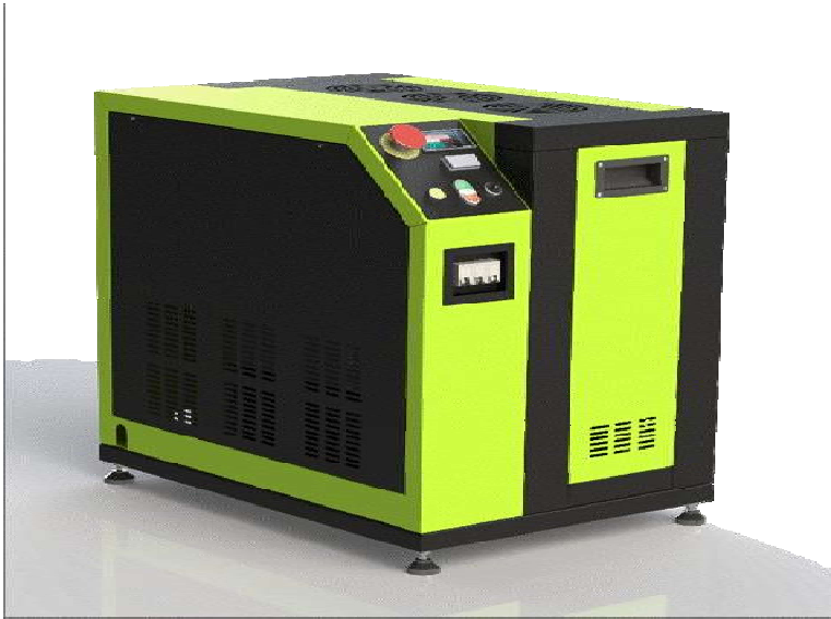
Рис.1. Общий вид парогенератора