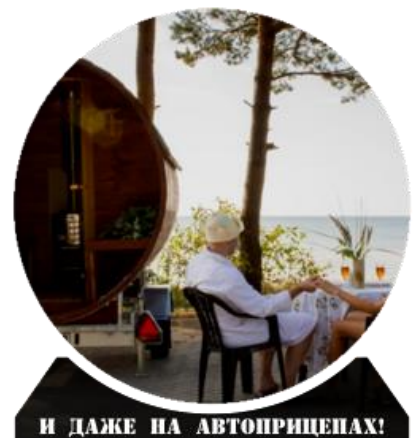
И ДАЖЕ НА АВТОПРИЦЕПАХ!