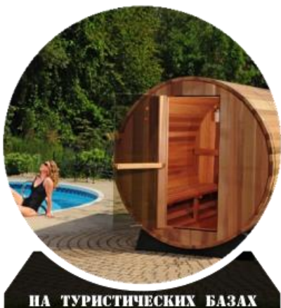
НА ТУРИСТИЧЕСКИХ БАЗАХ