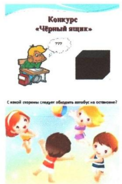
4. Как правильно обходить автобус?