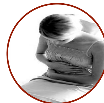
Снижение половой функции