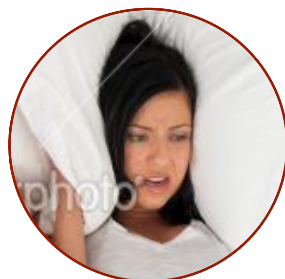
Проблемы с засыпанием