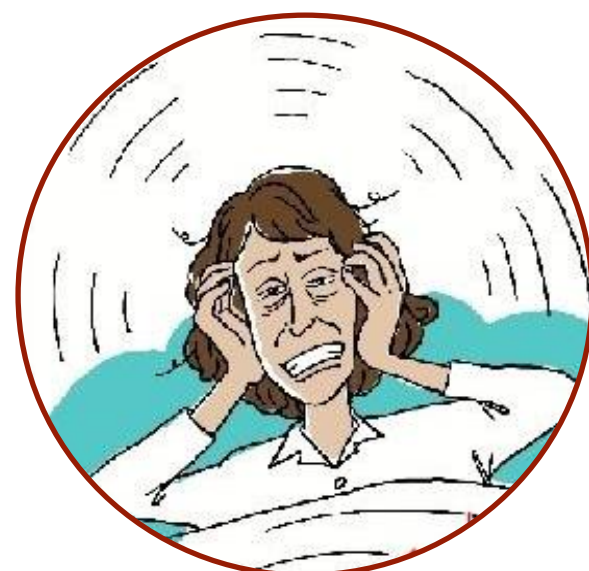
Поверхностный сон Частые сновидения