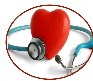
Заболевания сердца и сосудов