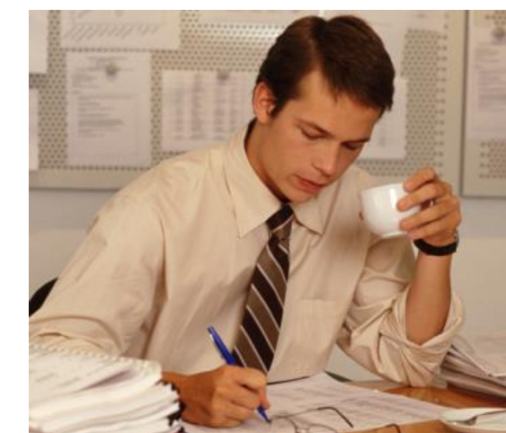
Чай и кофе сверх меры