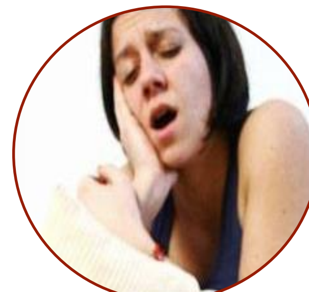
Плохое качество сна