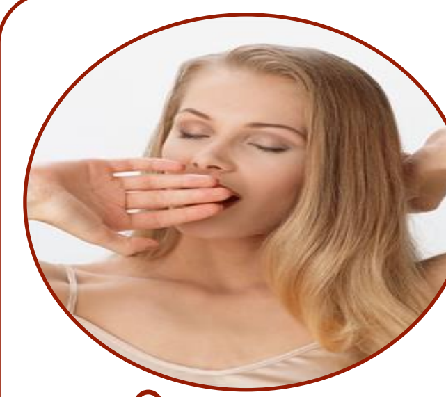
Ощущение разбитости и сонливость