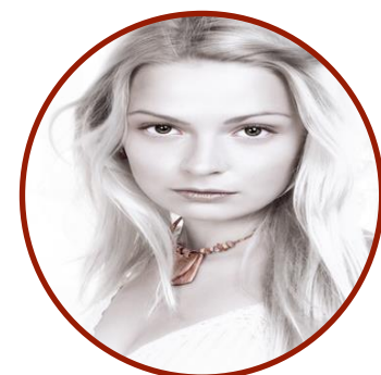
Бледность кожи и слизистых