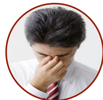
Слабость и упадок сил