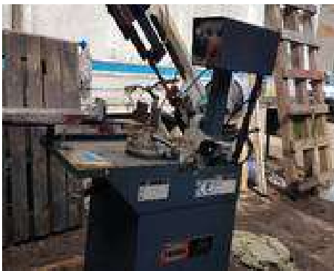
Станок ленточнопильный PROMA PPS170 Бу в хорошем состоянии В РЕМОНТЕ