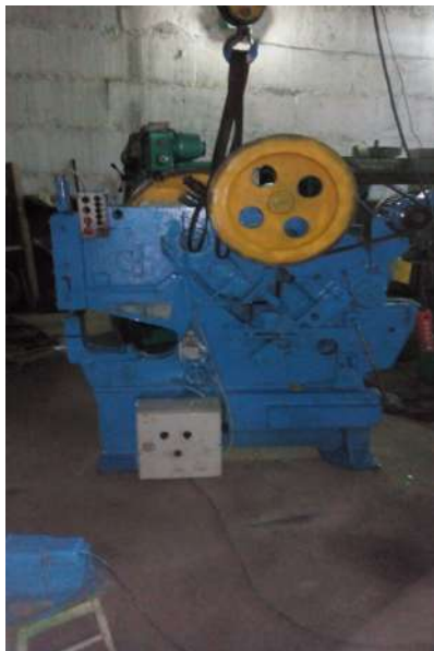
Пресс-ножницы HB5222 б/у в хорошем рабочем состоянии проведена предпродажная подготовка