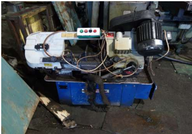
Станок ленточнопильный Way Train UE-712E до 180 мм