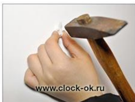
Установить крепежный элемент