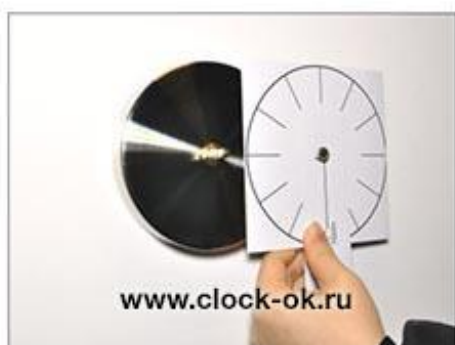
Установить шаблон на часовой механизм и закрепить квадратную (не подвижную) часть шаблона на часовом механизме (использовать канцелярский скотч)