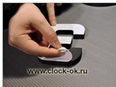
Снять защитный слой с угла цифры (1-2см). ВАЖНО: не снимать защитный слой полностью