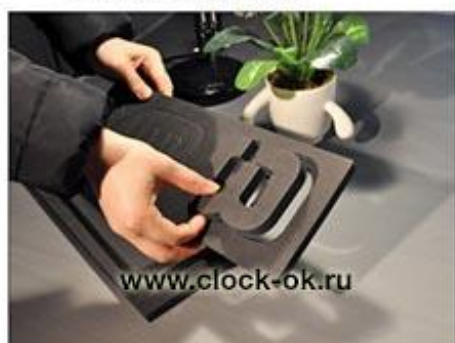
Достать все цифры из трафарета