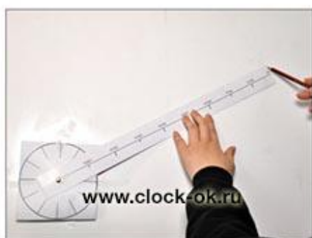
Отметить расположение остальных цифр