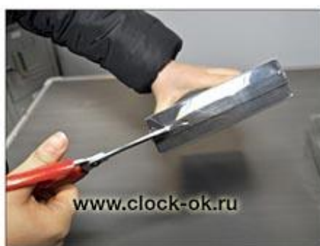
Аккуратно распаковать основание цифр