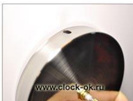
Установить часовой механизм (крепежный элемент в комплекте подходит только для кирпичных стен)