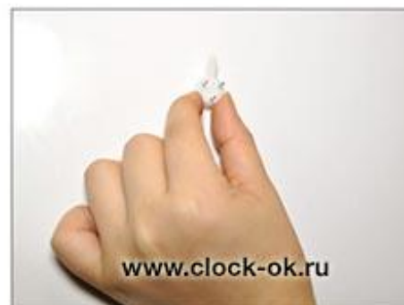
Наметить место установки