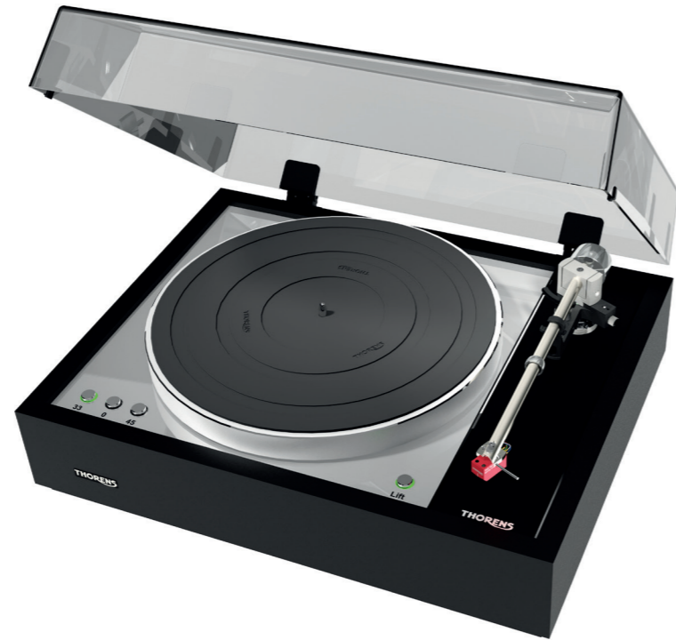
... und heute 2020 TD 1600/1601 ... and today 2020 TD 1600/1601