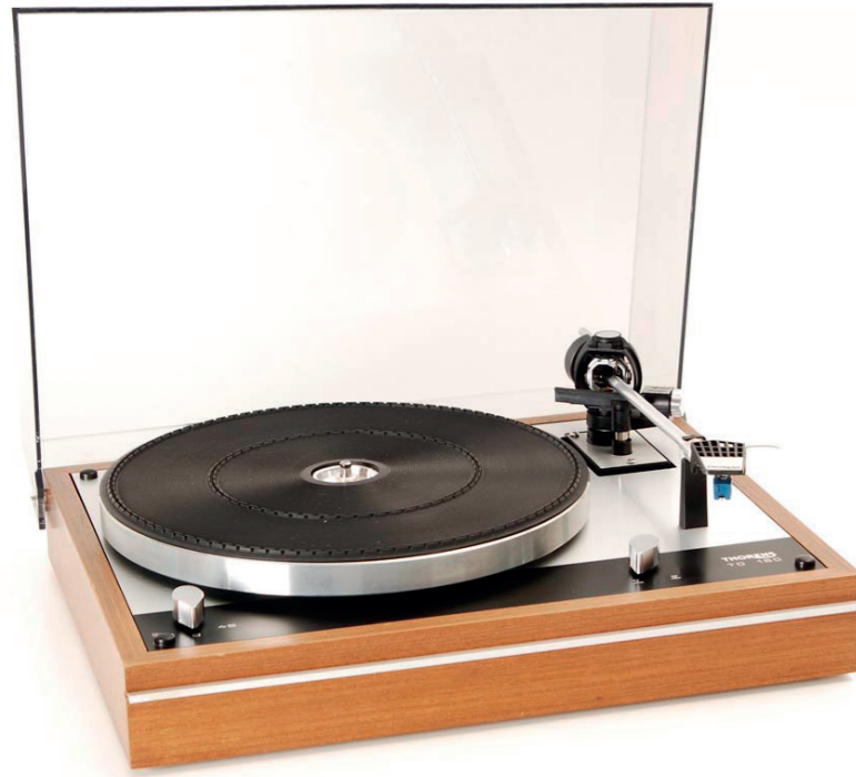
1972 TD160 ... 1972 TD160 ...