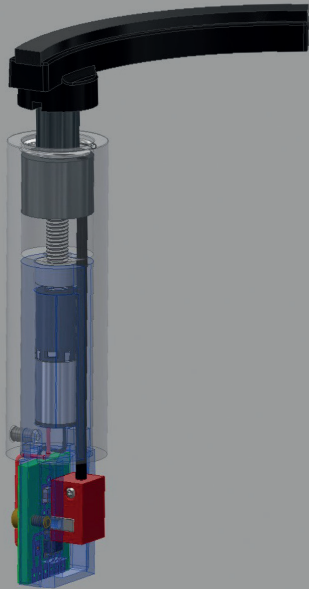
Patentierter elektronischer Lift für den TD 1601 // Patented electronic lift for the TD 1601