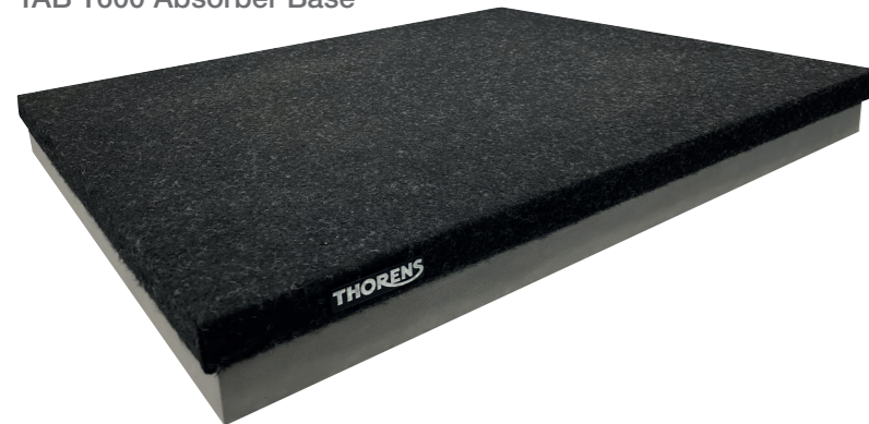
TAB 1600 Absorber Base TAB 1600 Absorber Base