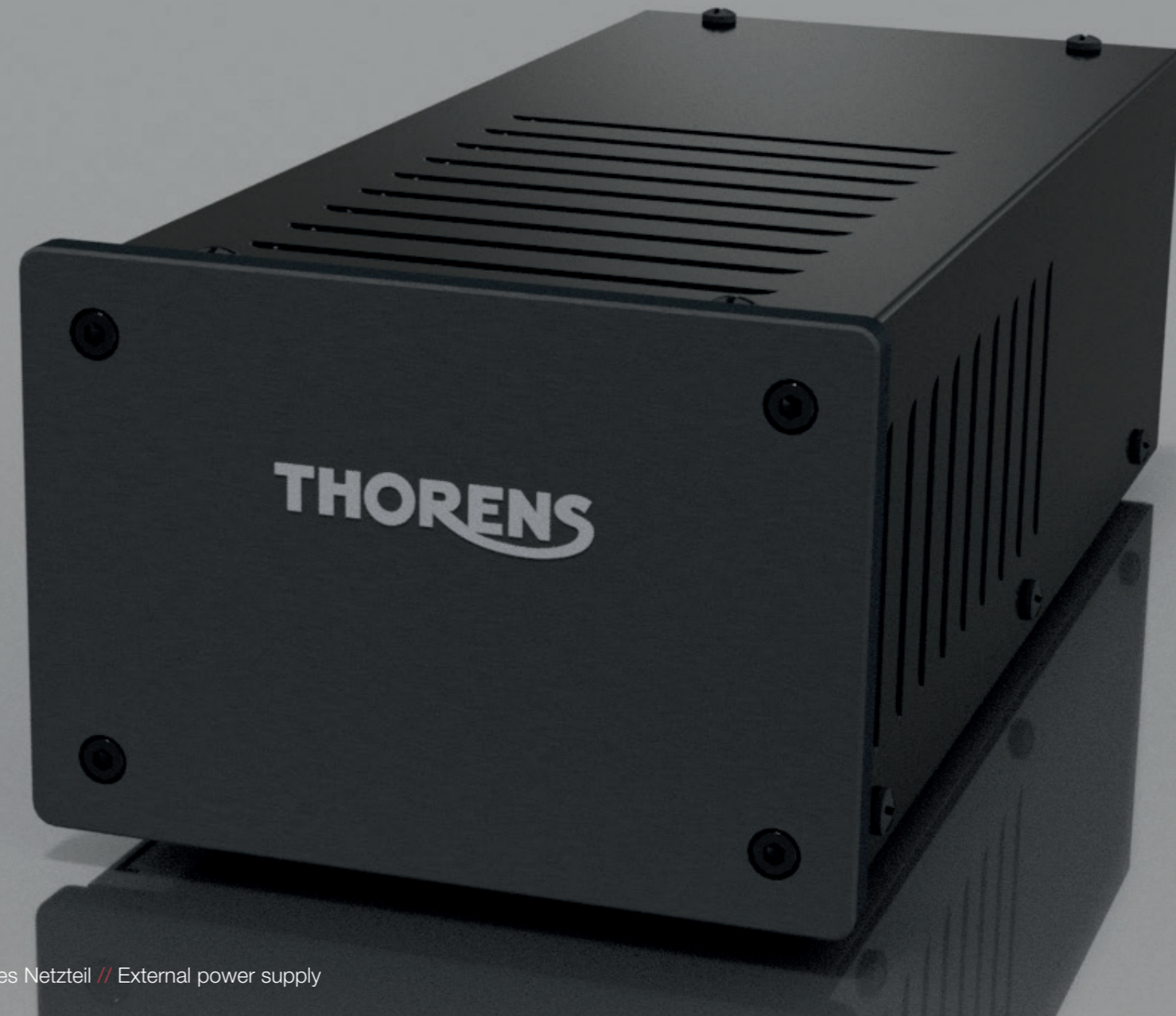
Externes Netzteil // External power supply

For the tonearm we equip TD 1600 and TD 1601 with our tried and tested TP92. This classic 9-incher is made from a highly precise and internally dampened aluminium tube. An anti-resonance ring mounted on the outside of the tube in a carefully calculated position additionally quietens the tonearm tube. The TP92 is thus ideally equipped to be fitted with all kinds of high-quality pickups; the scaled counterweight makes it easy to precisely set the required tracking force.