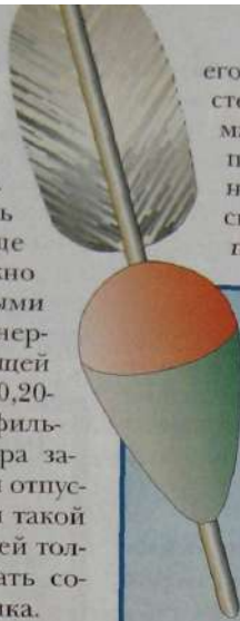
Рис. 2. Пенопластовый поплавок с антенной из гусиного пера.

лический, лучше мягкий вольфрамовый, очень хороши поводки из кевлара. Для других хищников можно применять поводок, изготовленный из монолески диаметром 0,30-0,33 мм и длиной не менее 35 см. Между поводком и леской необходи-