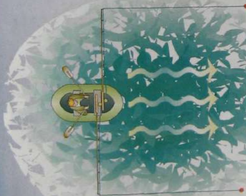
Рис. 1. Крепление удилища по бортам лодки.

Огрузка поплавок должна быть хорошо выверена, чтобы хищник при поклевке не чувствовал сопротивления снасти. Используется грузило обтекаемой формы, обычно "оливка" (одна или две) весом 10-20 г, которая чуть выше поводка стопорится свинцовой дробинкой.