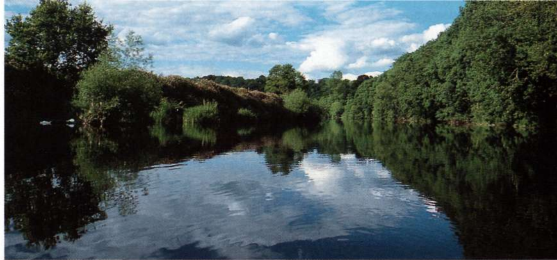
Реки со слабым и средним течением – идеальное место для оснастки с “волшебным поплавком”.

“Волшебный поплавок” нельзя купить, мы сделаем его сами. Это очень просто и почти не требует затрат времени и денег. Необходимы следующие материалы: быстро сохнущий клей, зеленая водостойкая краска, крупная свинцовая дробинка, кормушка с дырочками в крышке, пенальчик из-под таблеток, кое-какой несложный инструмент. Разломаем сначала кормушку, от которой нам потребуется только крышка. Еще понадобится вертлюжок с карабином. Карабин