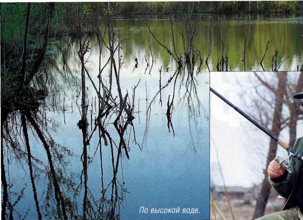
По высокой воде.

тиковым удилицем, которое постоянно приходится держать в руке. Катушка Catana – «тысячник». Диаметр лески должен быть не меньше 0,2 мм, так как крупный карась после подсечки стремительно бросается к траве. Иногда в счи-