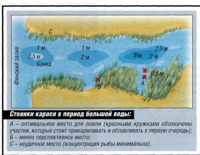
Стоянки карася в период большой воды:

При подъеме в реки во время нереста карась неплохо реагирует на прикормку. Я пользуюсь как фирменными составами, так и привадами собственного приготовления. Карась любит сладковатую прикормку, поэтому неплохо добавлять в нее ваниль, две-три капли меда, кусочек халвы. Если течение очень сильное, то забрасываю прикормку в сетчатой кормушке с буйком. Впрочем, карась редко стоит на струе, а ищет затишья. Правильно выбрать место среди водной растительности –