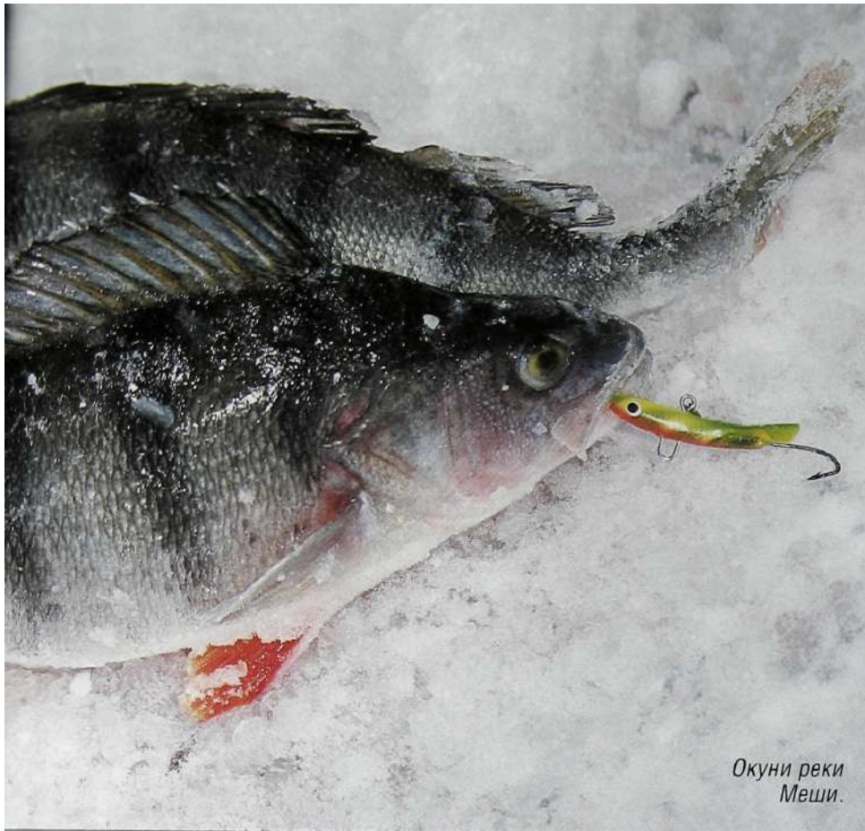
Окуни реки Меши.

если течение было сильным, то ловил традиционной судацкой блесной. При ловле на балансир я заметил важную закономерность: больше всего поклевки у меня и