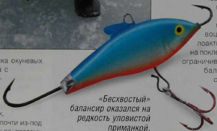
«Бесхвостый» балансир оказался на редкость уловистой приманкой.

Если окунь рассредоточен из одной лунки удается выловить лишь одного-двух «мат-