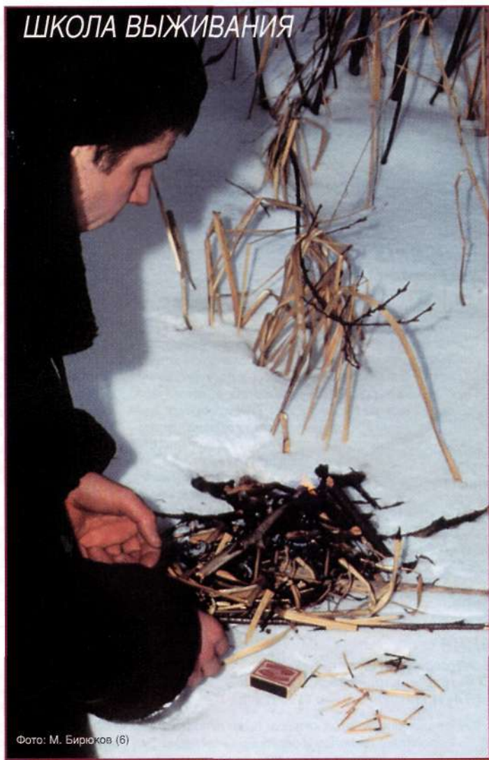
Фото: М. Бирюков (6)