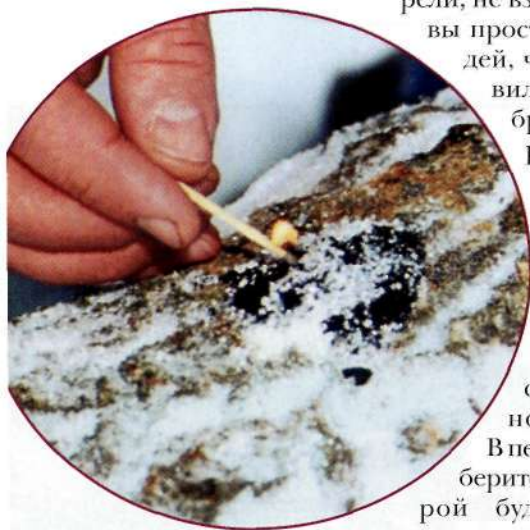
Поджигаем полученную смесь.

В первую очередь выберите коробку, в которой будет храниться комплект, лучше металлическую – она более прочная, в отличие от пластика. Край впоследствии (для герметичности) нужно будет заклеить полоской пластыря. Спички наполовину обломанные (для экономии места) вместе с теркой следует запаять в полиэтиленовый пакет. Впоследствии при необходимости их количество можно удвоить, расколов каждую вдоль, но чиркать придется, прижимая пальцем головку к терке. Уложите в коробку парафиновую