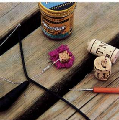
Тесто на донной оснастке обминают вокруг кусочка пенопласта и таким образом придают ему плавучесть.

карася в выволзка, и на маленького подлистника. Правда, черви на илистом дне плохо заметны, кроме того, они быстро зарываются в очень мягкий грунт. В этом случае нужно использовать желтые зерна консервированной кукурузы, которые яркой окраской и сладким ароматом привлекают карася. Вареной фасолью и люпином его тоже можно соблазнить. Кроме вышеназванных приманок, не помешает и еще одна великодушная насадка – тесто. Особенно подходит для