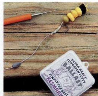
Эти зерна кукурузы всплывают благодаря кусочку пенопласта. Чтобы всплывал не весь поводок, примерно в 10 см от крючка размещают кусочек мягкого свинца в качестве якоря.