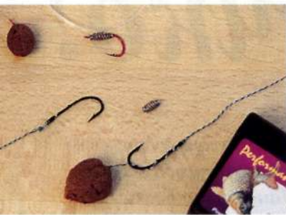
Специальные крючки для насадки теста. Спираль привязывают к крючку на волосе.