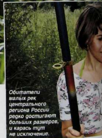
Обитатели малых рек центральной России редко достигают больших размеров, и карась тут не исключение.

Во-первых, чаще всего он ловится на участках рек ниже сброса воды с плотин. Его многочисленные стаи, идущие на нерест, устремляются вверх по течению на прогреваемые мелководья. Поскольку в реке темпера-