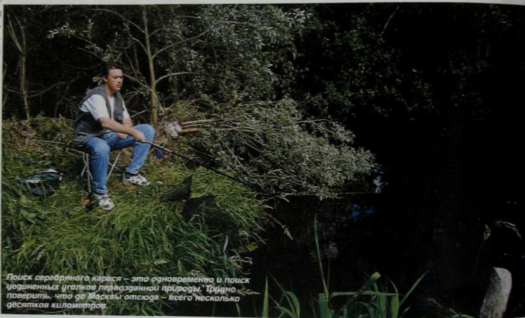
Поиск серебряного карася – это одновременно и поиск уединенных уголков первозданной природы. Трудно поверить, что до Москвы отсюда – всего несколько десятков километров.

Как правило, в намеченный участок ловли я сначала забрасываю 300–400 г смеси, а затем в промежутки времени от 10 до 20 минут добавляю по 1–2 шара величиной с грецкий орех, в