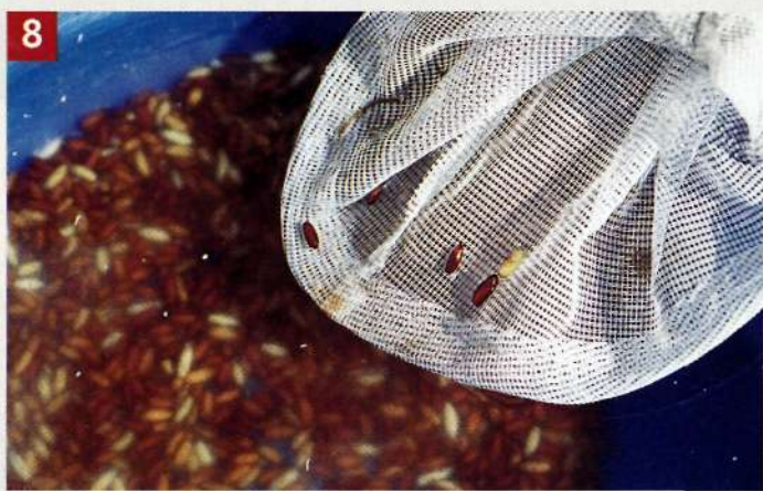
8 На рыбалке куколки держат в воде. Тонущие и всплывающие кастеры разделяют с помощью аквариумного сачка.

знать, что куколки при забросе легче слетают с крючка, чем личинки. Для подстраховки следует насаживать на крючок по две куколки на тот случай, если одна при забросе соскочит. Темные всплывающие кастеры (Floater) — особенно качественная насадка. Они не только богаты протеином, но и уменьшают вес крючка, обеспечивая тем самым более естественную подачу приманки.