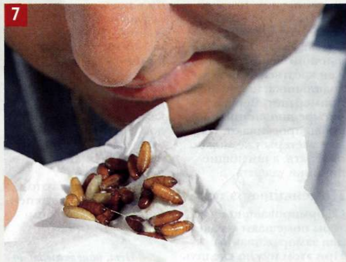
7 Являются ли кастеры еще хорошими, можно определить по запаху.