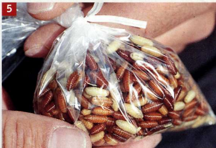
5 Готовые кастеры собирают в пластиковый пакет и хранят в холодильнике так же, как и личинки.

торые лежали в воде, их не следует выбрасывать. Их можно подсушить на хлопчатобумажной салфетке или на туалетной бумаге и снова положить в холодильник. Впрочем, эти мертвые куколки следует использовать на следующий же день или через день. Не смешивайте эти кастеры с живыми в пакете. Чем свежее и темнее куколка, тем прочнее ее внешняя оболочка. Важно