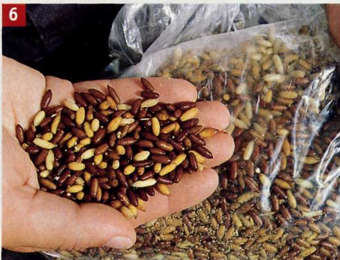
6 После каждого последующего просеивания пакет все больше и больше наполняется светло-коричневыми куколками (кастерами).

важно, чтобы куколки все время, особенно в солнечную погоду, находились в воде, иначе они будут слишком быстро развиваться. По этой же причине целесообразно все количество кастеров за один раз добавлять в прикормку. Для каждого нового шара прикормки нужно доставать куколки из воды и добавлять в корм. Если после рыболовного дня останутся куколки, ко-