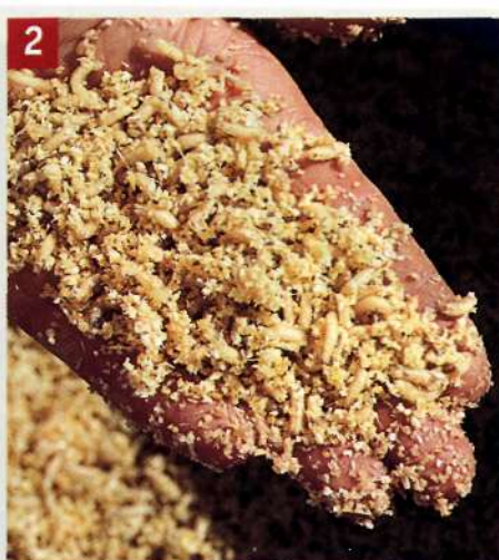
2 Пол-литра слегка увлажненных мелких отилок смешивают с личинками.