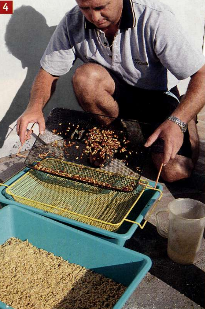
4 Через несколько дней личинки снова просеивают и кастеры отделяют.