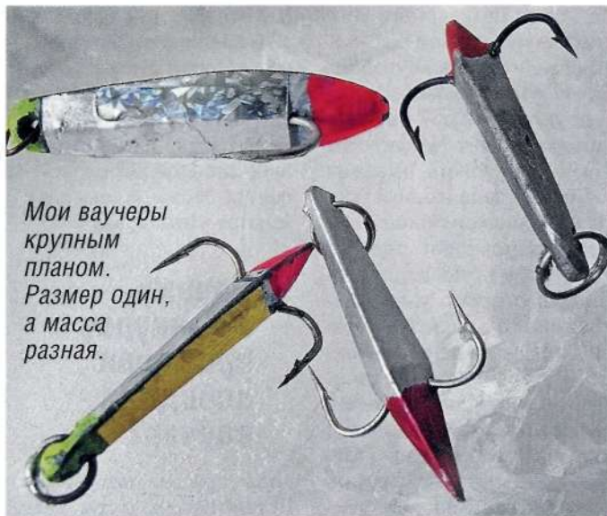
Мои ваучеры крупным планом. Размер один, а масса разная.

В настоящее время магазины встречают рыболова-любителя таким разнообразием и обилием различных рыболовных товаров, какое нам, нынешним пенсионерам, и не снилось. Кто бы мог подумать лет 20-30 тому назад, что все это ожидает нас в ближайшем будущем. Лески, крючки, катушки, удильники, сторожки и т.д. Приманки, включая мормышки, блесны летние и зимние. Балансиры – какие угодно. Только выберите! И уж точно, в рыболовных магазинах Волгограда вы найдете и ваучеры.