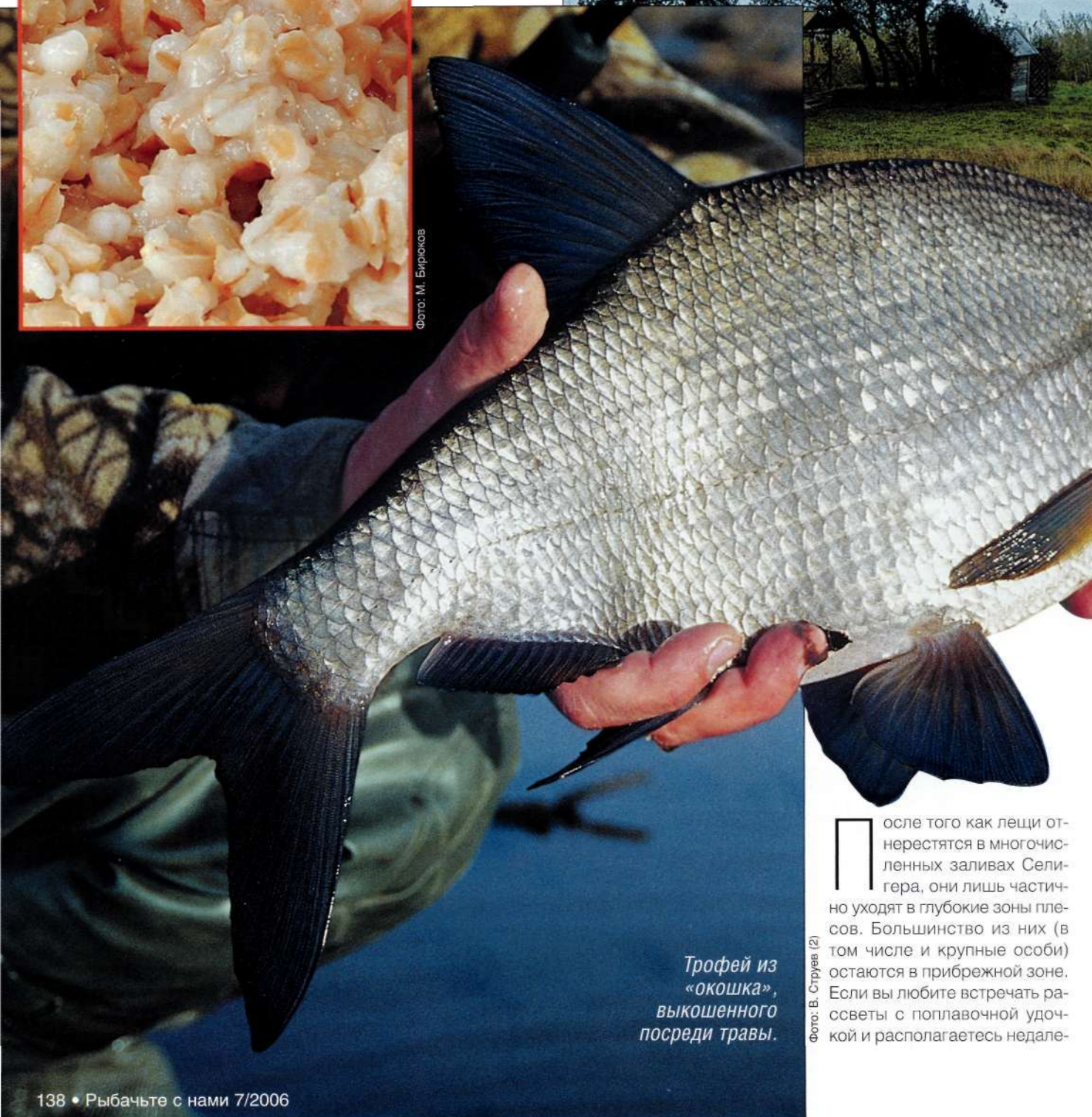
Трофей из «окошка», выкошенного посреди травы.