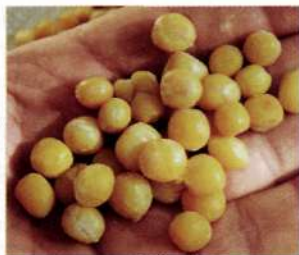
Готовый к рыбалке горох.

Пареный горох я готовлю следующим образом. Поллитровую банку сухих горошин заливаю холодной водой, объем которой раза в два превышает объем гороха, и замачиваю в течение шести-восьми часов. Потом пересыпаю набухшие семена гороха в капроновый женский чулок, плотно завязываю его, помещаю в кастрюлю-скороварку; заливаю в нее воду до верхней метки, закрываю крышкой и довожу до кипения. Варю горох 45-50 минут (время варки зависит от степени спелости гороха и определяется опытным путем). По окончании процесса готовый горох рассыпаю на газете и жду полного высыхания. Правильно приготовленный горох должен представлять собой заключенное в оболочку пюре и легко раздавливаться пальцами.