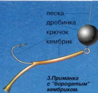
3. Приманка с "бородатым" кембриком.