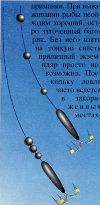
2. Утяжеление "чертиков".

приманки. При вываживании рыбы необходим хороший, остро заточенный багорик. Без него взять на тонкую снасть приличный экземпляр просто невозможно. Поскольку ловля часто ведется в закоряженных местах,