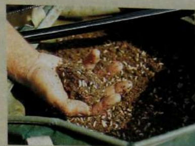
Полная горсть соответствует размеру прикормочного шара.

Неблагоприятным обстоятельством для ловли болонским методом является дующий вниз по реке ветер (который тянет леску по течению и мешает ее контролю) и дождь. В этом случае леска заливает в кольцах и заброс становится невозможным, разве что воспользоваться очень тяжелой оснасткой. Но это единственный недостаток болонской удочки.