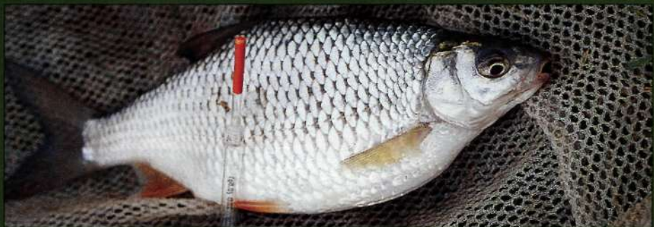
Упитанная плотвица взяла тонущего опарыша вполводы.

Нехищные рыбы чаще всего кормятся со дна или на поверхности. Но летом они нередко ищут корм в средних слоях воды. Это время, когда англичане успешно ловят по методу On the Drop в фазе падения приманки.