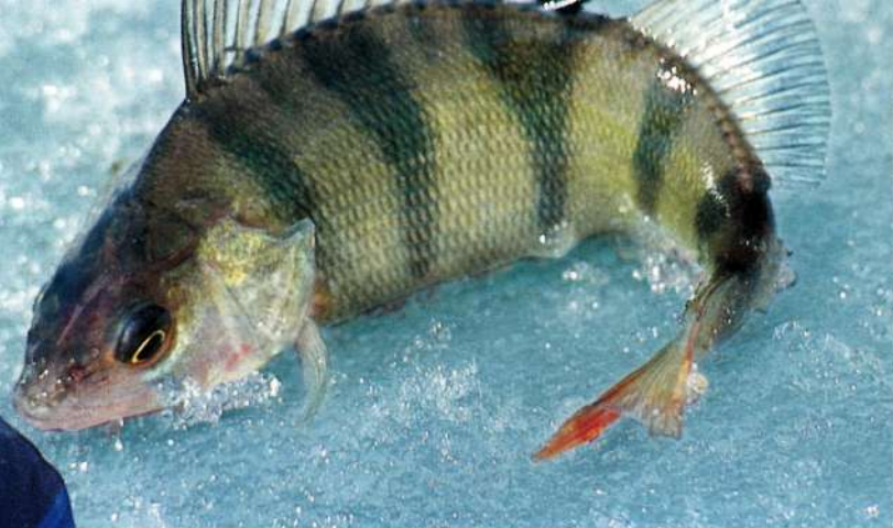
Фото: М. Бирюков (4)

по цене. Для ловли окуня беру приманки размером 40-55 мм, для судака и щуки – 60-80 мм. Более крупными не пользуюсь, так как они предназначены для сильного течения и большой глубины. Кстати, балансиры Rapala имеют плохую зацепистость из-за маленьких крючков, что приводит к сходам рыбы, особенно крупного окуня. Балансиры размером 60-80 мм имеют такой же недостаток, поэтому у их пере-