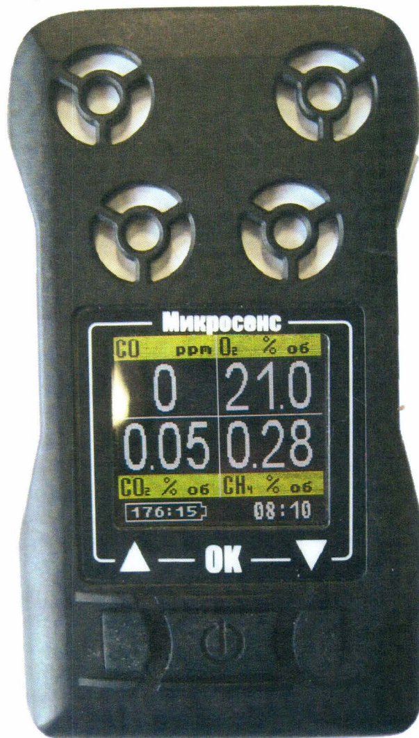
Рисунок 1 - Внешний вид газоанализаторов портативных Микросенс

Внешний вид газоанализаторов приведен на рисунке 1, схема пломбировки от несанкционированного доступа - на рисунке 2.