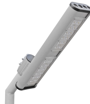
Рис. 1. Светильник «Модуль Магистраль» консоль КМО-1, 56 Вт, IP67.