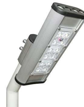
Рис. 1. Светильник «Модуль Магистраль» консоль КМО-1, IP67.