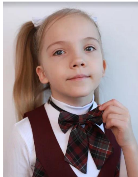
Бант 380 руб.