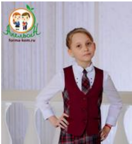
Классика 290 руб.