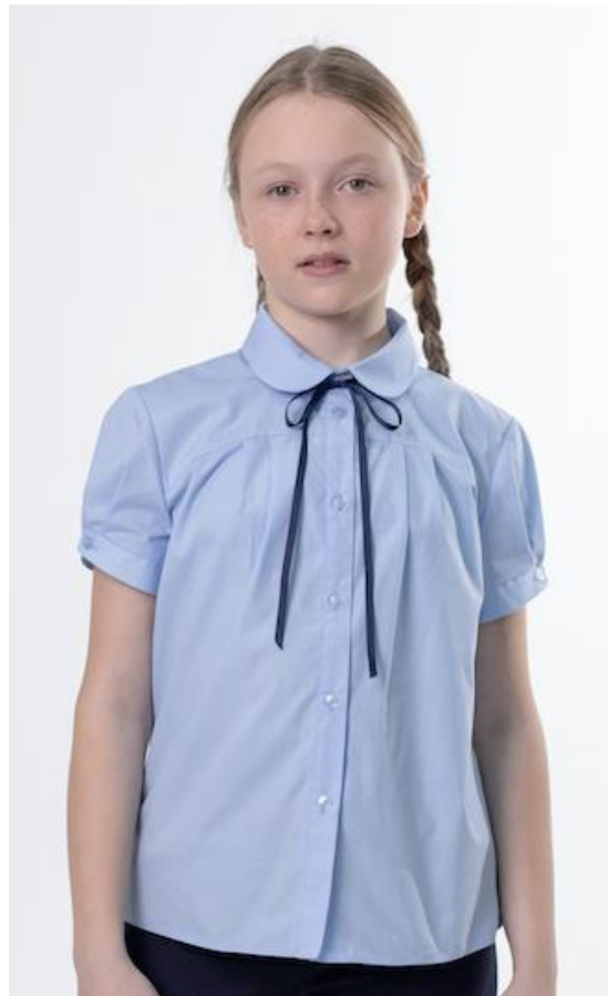
В-2400 бел,роз,джинс Цена: 999руб.