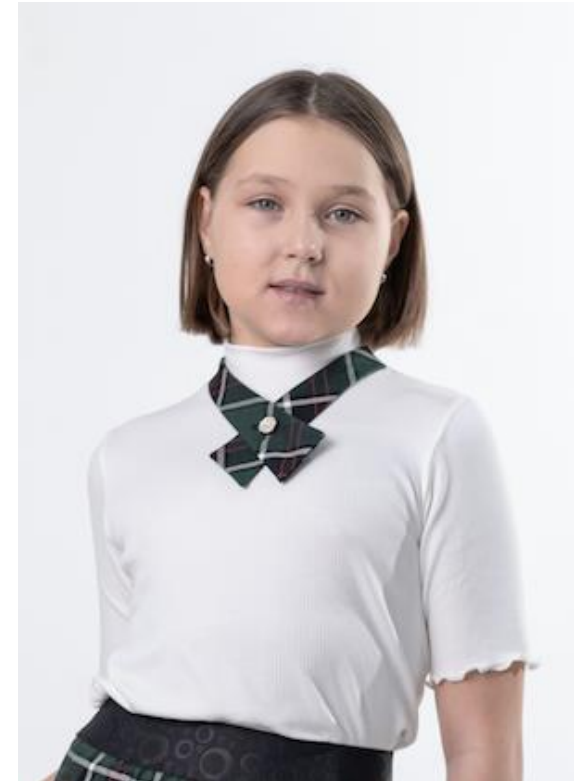
Д 5117 Цена: 1859/1899/1979руб.