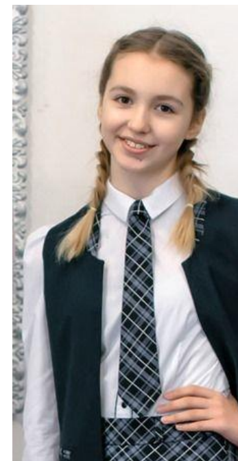
Классика 399 руб.