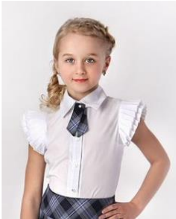
Д 5040 Цена: 1809/1879/1939руб.