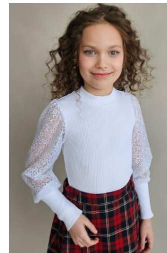
В-2401 Цена: 1249руб.