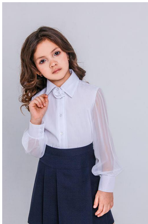
Д 5133 Цена: 2009/2069/2139руб.