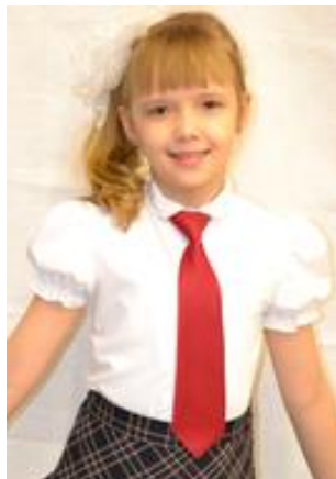
Классика 389 руб.