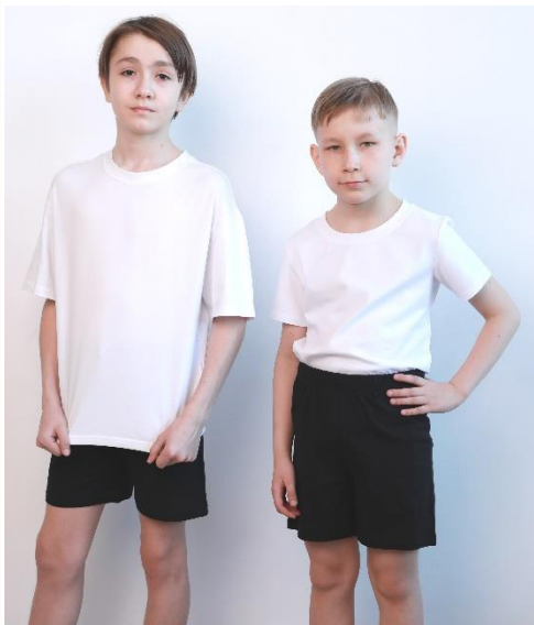
Ш-1801 Шорты для мальчиков ХБ – 100%

Цена: 499/539/569руб. р. 116-128/134-158/164-170