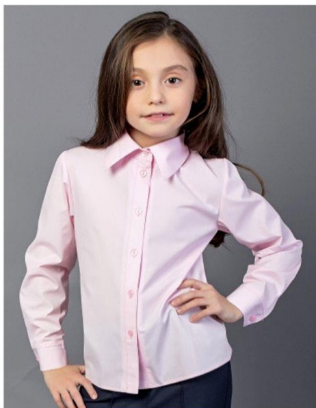
Д 5066 (белый, голубой, розовый)

Состав: ХБ-100% или ХБ - 92%, лайкра - 8%