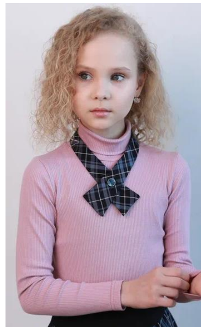
В-2306 (белый, розовый, голубой) Цена: 1059руб.