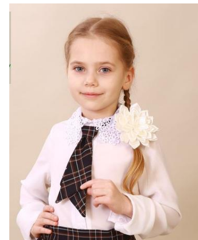
Ласточка 489 руб.