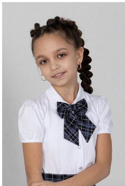
Бант 380 руб.