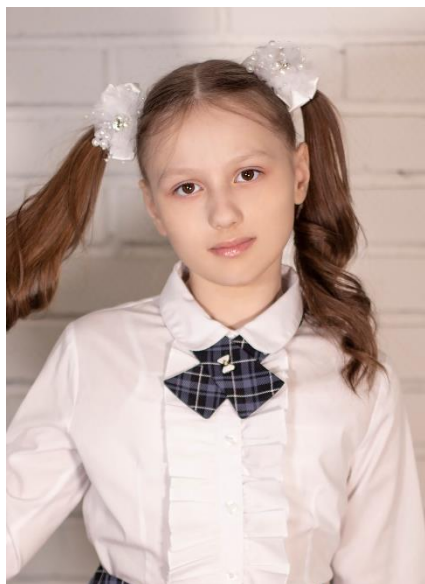
Птичка 290 руб.