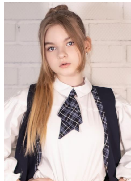
Ласточка 380 руб.