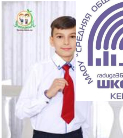
ШЕВРОН школьный (эмблема) с вышивкой Цена 299 руб.