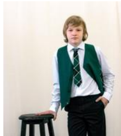
ГАЛСТУК в клетку на резинке 35см Цена 399 руб.