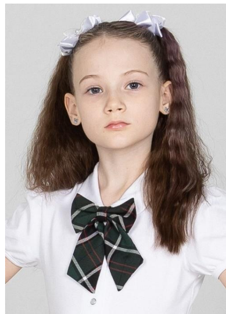
Бант 489 руб.