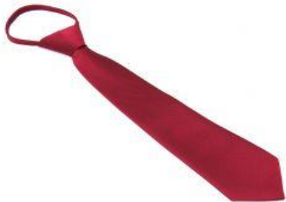
ГАЛСТУК однотонный на фиксаторе 35см/42-48см Цена 389/459 руб.