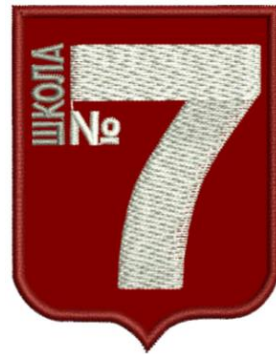
ШЕВРОН школьный (эмблема) с вышивкой Цена 299 руб.