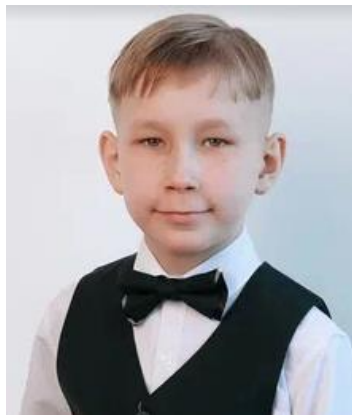
ГАЛСТУК - БАБОЧКА клетка/однотон на резинке 11см Цена 459 руб.