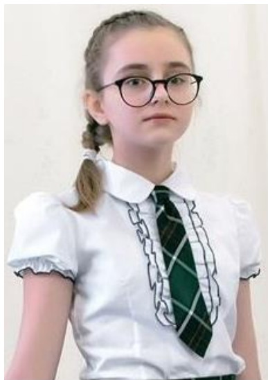
Классика 399 руб.