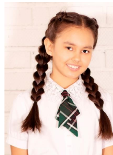
Ласточка 489 руб.