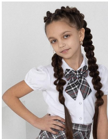
Бант 489 руб.