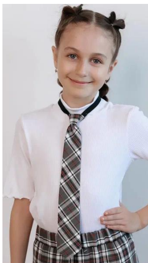
Классика 399 руб.