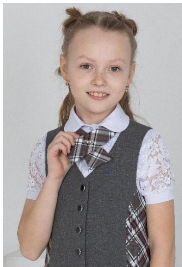
Птичка 399 руб.