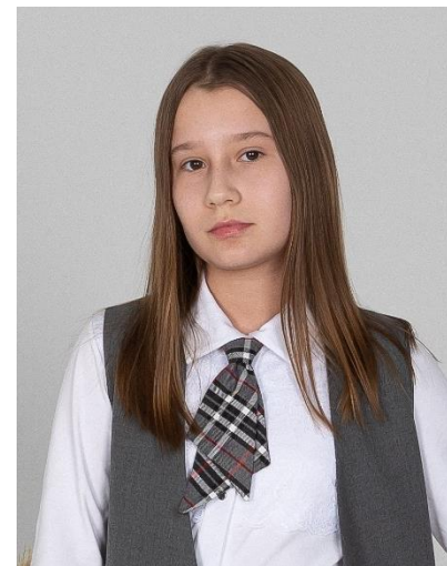
Ласточка 489 руб.