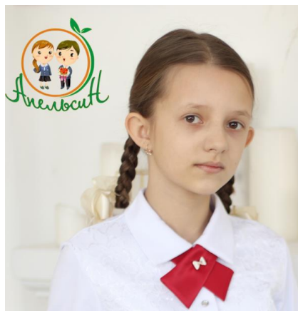
Птичка 290 руб.