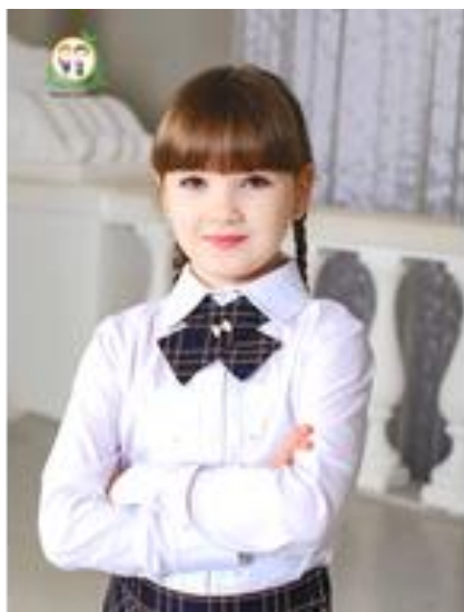
Птичка 290 руб.