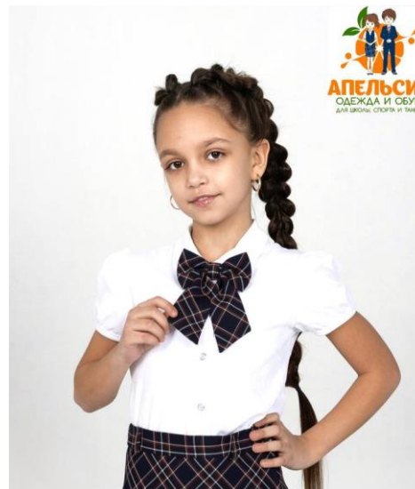
Бант 380 руб.