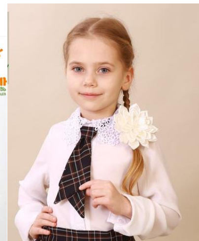
Ласточка 380 руб.