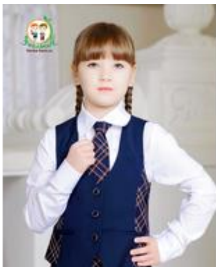
Классика 290 руб.