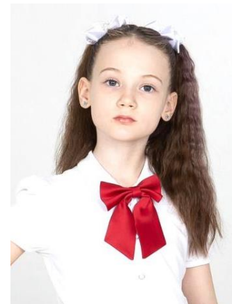
Бант 380 руб.