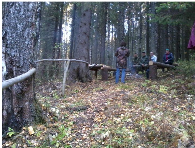
Место отдыха и привала «Родник»