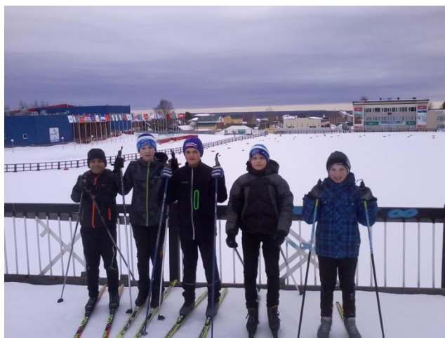
Маршрут пройден, конец маршрута на РЛК.

МБУДО «Районный центр внешкольной работы с. Вьльгорт»